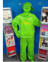
tipp - infopoint