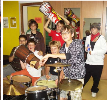
Workshops für 6.Klässler